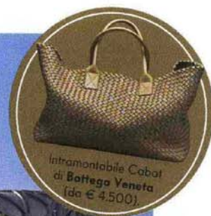
Intramontabile Cabot di Bottega Veneta (da € 4.500)