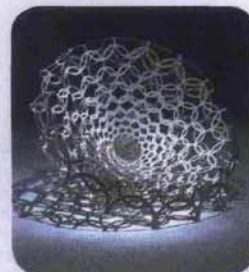
Tropicalia , disegnata da Patricia Urquiola, è in tondini d'acciaio e fili di gomma, Moroso . In membrane strutturali d'alluminio, che imitano le travi architettoniche, Ycami (€ 1.300). Dalla collezione Canasta , divano rotondo da esterno in fibra di polietilene, 182x185x88 cm, B&B Italia (da € 3.845). Edizione limitata per Veryround di Louise Campbell, in lamiera d'acciaio tagliata al laser, Zanotta (da € 3.260).