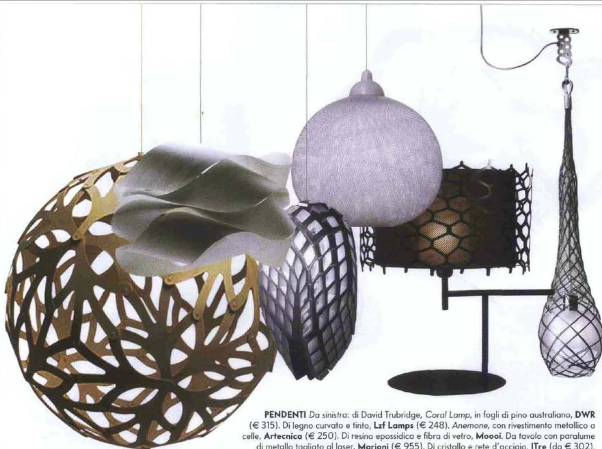
PENDENTI Da sinistra: di David Trubridge, Coral Lamp , in fogli di pino australiano, DWR (€ 315). Di legno curvato e tinto, Lzf Lamps (€ 248). Anemone , con rivestimento metallico a celle, Artecnic a (€ 250). Di resina epossidica e fibra di vetro, Moooi . Da tavolo con paralume di metallo tagliato al laser, Marioni (€ 955). Di cristallo e rete d'acciaio, ITre (da € 302).